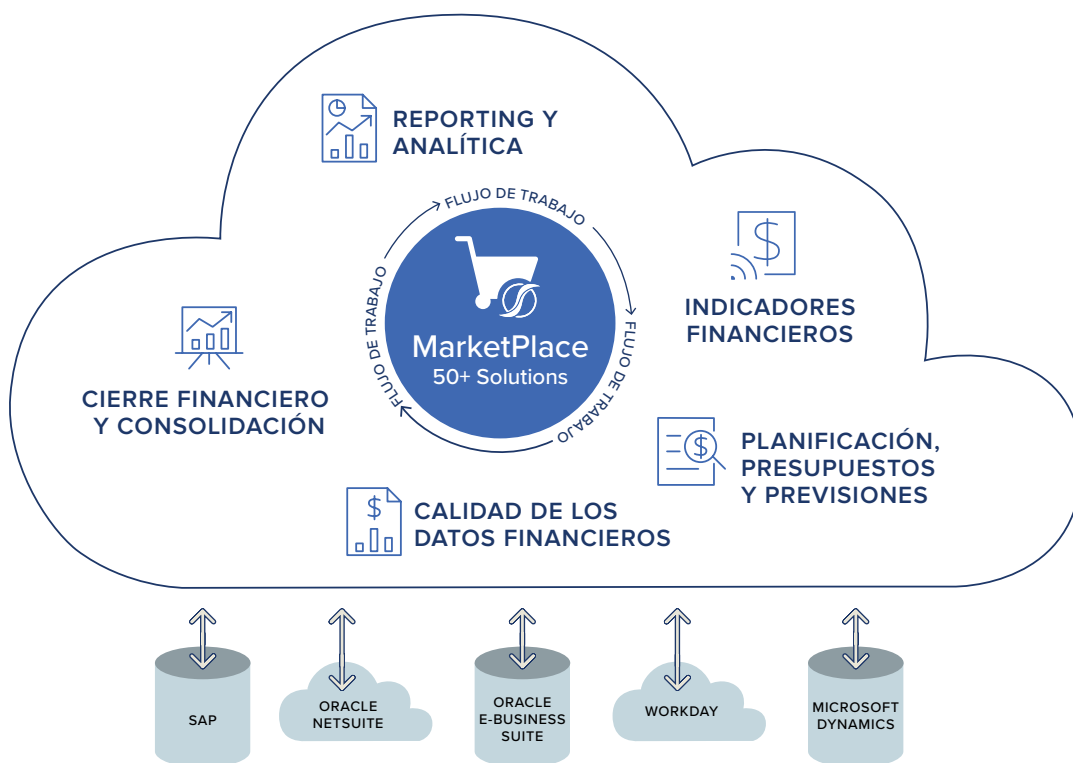
Figura 2 — Plataforma Financiera Inteligente de OneStream